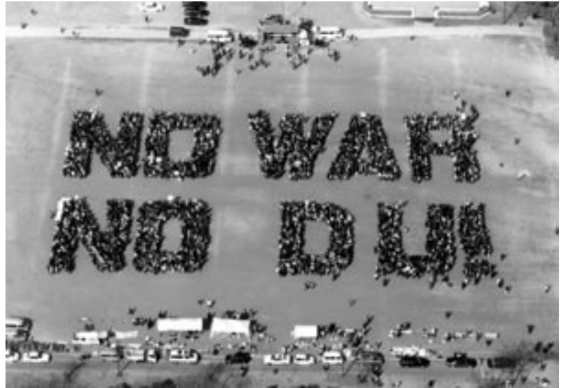
Hiroshima, 2 maart 2003. Demonstratie in het centrale park van Hiroshima, niet ver van de herdenkingskoepel van de atoombom.