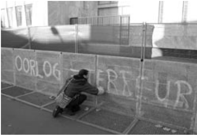
De tweede activiste brengt met stoepkrijt een tekstje aan op het buitenste hek rondom de ambassade.