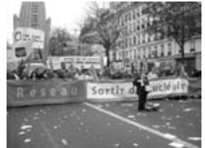
Het anti-nucleaire 'blok' tijdens de demonstratie van het Europees Sociaal Forum, afgelopen november in Parijs

De Franse regering stelt dat wanneer Greenpeace in staat is om informatie over kernafvaltransporten en kerncentrales te verzamelen, terroristen dat ook kunnen. Ook irritaties over toenemende acties van anti-kernenergiegroepen, met name tijdens transporten, spelen ongetwijfeld een rol. Overigens bereikte - ondanks de nieuwe wet - ook dit jaar de informatie over het vertrek uit de opwerkingsfabriek La Hague van het kernafvaltransport naar Gorleben, de Franse en Duitse anti-kernenergiegroepen weer prima en is er nog geen bericht over juridische stappen daartegen.