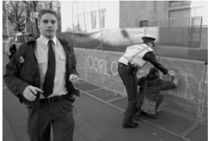
Uw actiefotograaf wordt als 'medeplichtige' gezien: 'Fotograferen op de openbare weg mag. Bovendien doe ik gewoon mijn werk, hier is mijn perskaart', Aldus Boyd.

De stoepkrijtactiviste belandde vanwege de actie bij de VS-ambassade op 7 november vijf uur in een politiecel. Hieronder een deel van haar commentaar op de arrestatie.