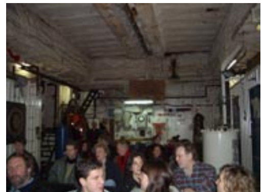
Binnenin het Greenpeaceschip.

Meer info: www.climatecrisis.net of www.degrotedooi.nl