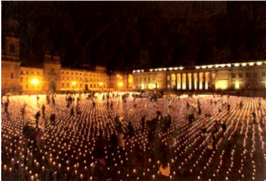
De kaarsjes op het plein zijn een stil protest van de Columbianen

UITGAVE: PAIS, HUMANISTISCH VREDESBERAAD & HAAGS VREDES PLATFORM, JAARGANG 30, NUMMER 5, JULI 2007