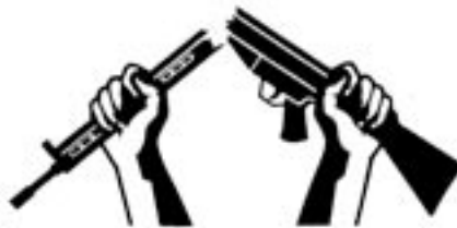
Het "gebroken geweer" is al sedert de oprichting in 1921 het symbool van War Resisters International.

Pais is meer dan een kleine organisatie in een klein land. Via onze internationale organisatie 'War Resisters International' zijn we overal in de wereld actief, in het bijzonder daar waar brandhaarden zijn. We zijn zelfs officieel vertegenwoordigd bij de Verenigde Naties!