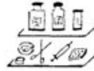
40.000 plattelands- apotheken