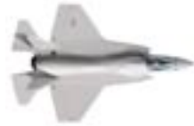
1 JSF-fighter (43 miljoen euro)