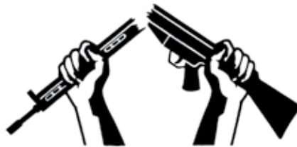
Het "gebroken geweer" is al sedert de oprichting in 1921 het symbool van War Resisters International.

Pais is meer dan een kleine organisatie in een klein land. Via onze internationale organisatie 'War Resisters International' zijn we overal in de wereld actief, in het bijzonder daar waar brandhaarden zijn.