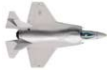
1 JSF-fighter (43 miljoen euro)