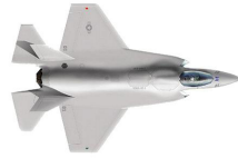
1 JSF-fighter (43 miljoen euro)