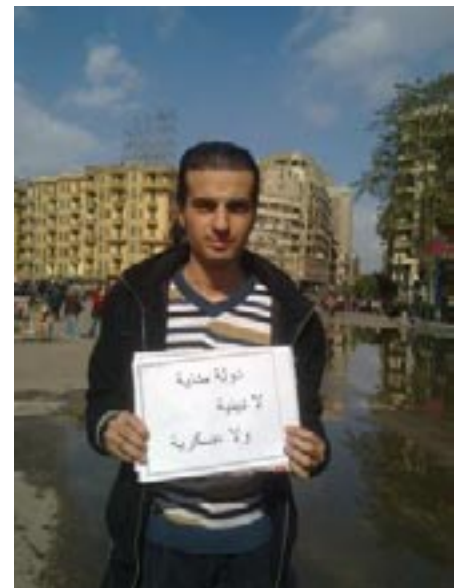
Maikel Nabil Sanad tijdens een demonstratie